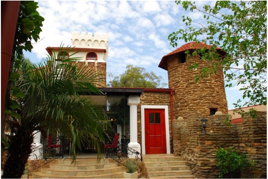
温得和克的城堡餐厅