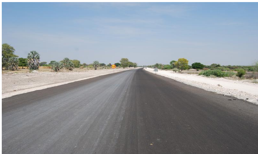
北部公路项目现场（河南国际公司承建）