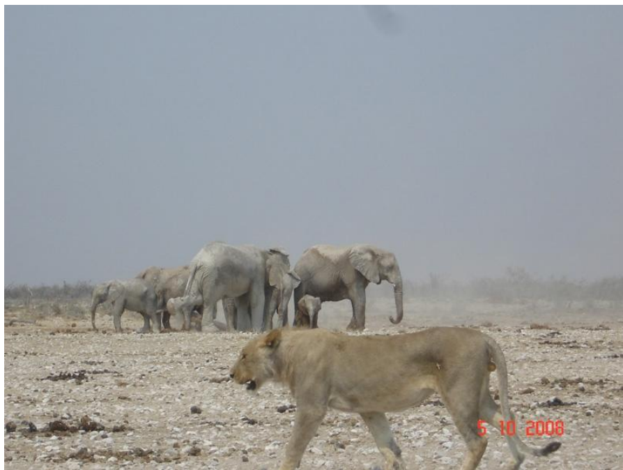
埃托沙野生动物园

纳米比亚位于东2时区，当地时间比格林尼治标准时间早2个小时，比北京时间晚6个小时。纳米比亚没有夏令时。